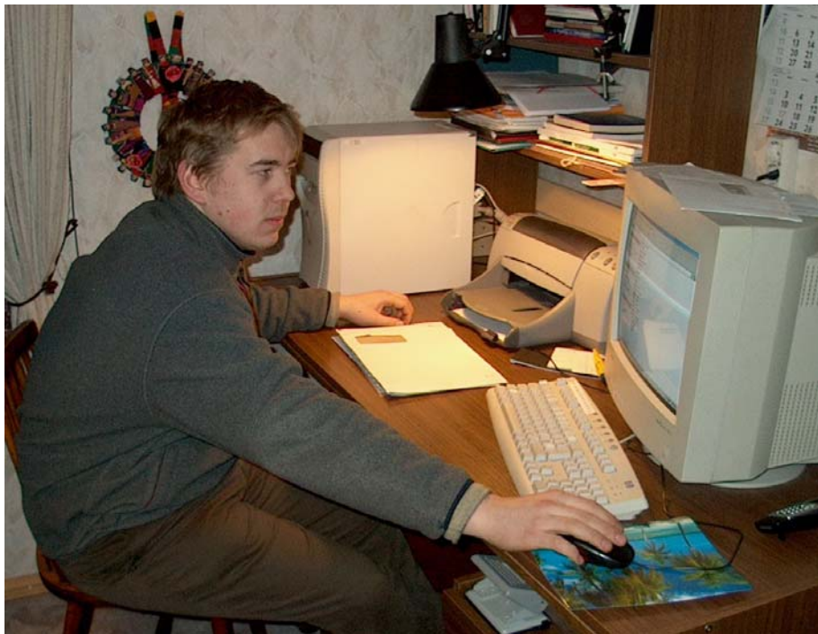
Lahutamatu paar: Alari ja arvuti.

Loodame ka edaspidi kuulda, millega Avinurme kooli tublid vilistlased praegu tegelevad.