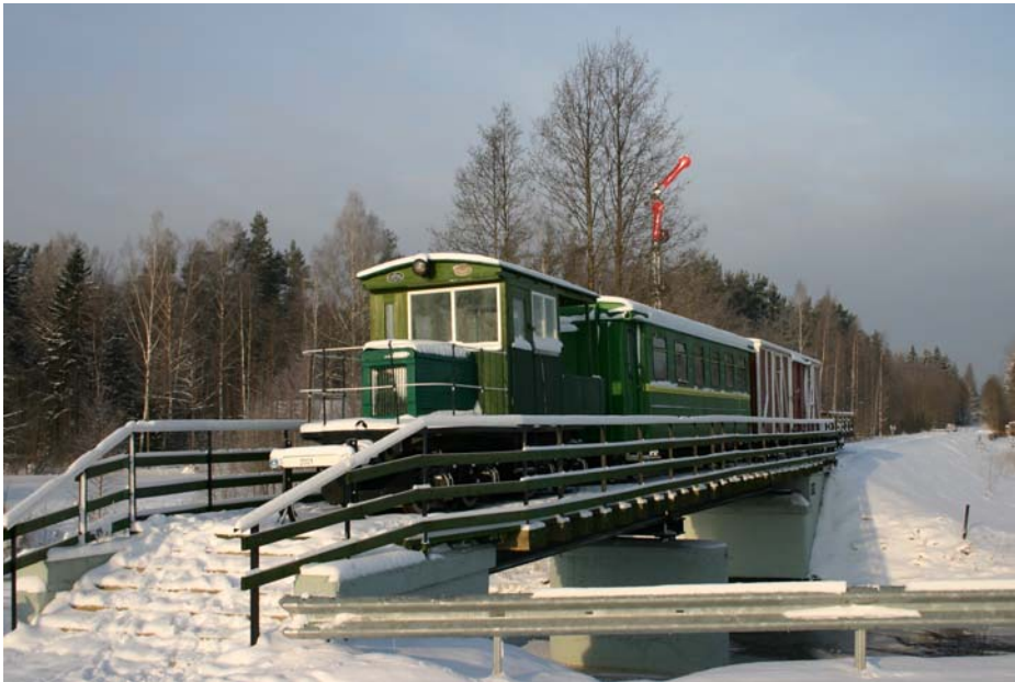
Talv Avinurmes. Muuseumraudtee kevade ootel.